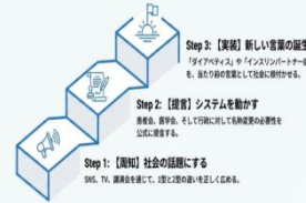
社会実装へのロードマップ

「スティグマを超えて—名称変更から考えるダイアベティスの新しい未来」昨年の inochi Gakusei Innovators' Program (iGIP) に参加した城之内中等教育学校のポブのちハレさんから、1 型糖尿病のスティグマを取り除くために、正しい病気の理解の必要性と名称変更へのロードマップが示されました。