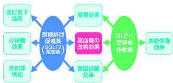
図1 最近明らかにされた糖尿病薬の多面的作用

糖尿病には、小児期からいずれの年代でも発症するインスリン産生細胞が破壊される1型糖尿病と、遺伝素因や加齢、そこに環境要因が関わる2型糖尿病に大別されます。大部分の糖尿病である2型糖尿病では、主たる治療薬は経口薬で、インスリンの分泌を促したり、その作用を高める薬に加え、糖質の消化を抑制したり、尿糖の排泄を促進する薬が開発されています。特に尿糖排泄促進薬は、腎臓や心臓への保護効果が示され、糖尿病以外の慢性腎臓病や心不全に対しても適応が広がっています(図1)。