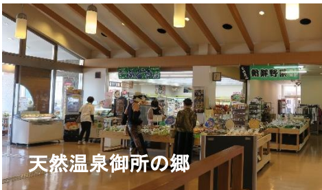
天然温泉御所の郷

まず総会で予算や今後の活動についての話し合いを行なった後、和風レストラン「秋月」での昼食。おいしい食事を楽しみながら、参加者同士で近況報告や健康管理についての話題が広がり、和やかな時間が過ぎました。昼食の後には、倉橋先生による講演「ランチ後のリフレッシュ！楽しく運動して血糖値改善と体力アップを目指そう」を行いました。血糖値の改善やフレイル予防のために日常生活に取り入れやすい簡単な運動療法を、実践を交えて学んでいただきました。最後に徳島大学の医学部学生が、徳島や糖尿病にまつわるクイズを開催。知識を深めながら楽しむことができ、会場は終始和気あいあいとした雰囲気に包まれました。久しぶりの遠足で、糖尿病を持つ方同士が直接交流できる貴重な機会となり、互いに励まし合いながら過ごせたことがとても印象的でした。次回の山桃の会ではより多くの方と一緒に過ごせることを楽しみにしたいと思います。