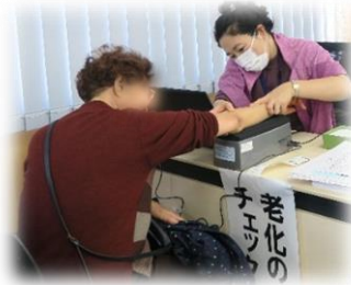
AGE測定(老化のチェック)