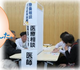
医療相談(糖尿病専門医)