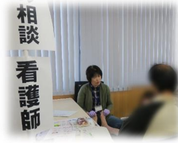
足の相談(糖尿病看護認定看護師)