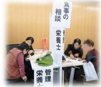
食事の相談(管理栄養士)